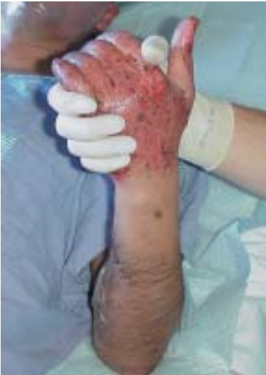
Nationale Patiëntendag: solidariteit

De Nederlandse Brandwondenstichting heeft heel even beroep gedaan op onze Stichting om de communicatie, het taalprobleem, tussen de slachtoffers en het verplegend personeel die opgenomen waren in Loverval en Liège, te regelen.